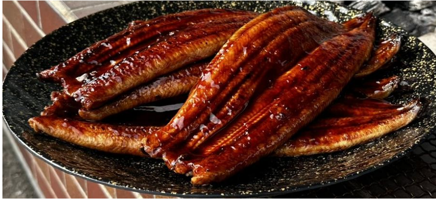
(提供する食べ放題のうなぎ)

寒い冬の二色浜で、「炭火×うなぎ×ごはん×出汁」をお腹いっぱい楽しめるラインナップです。